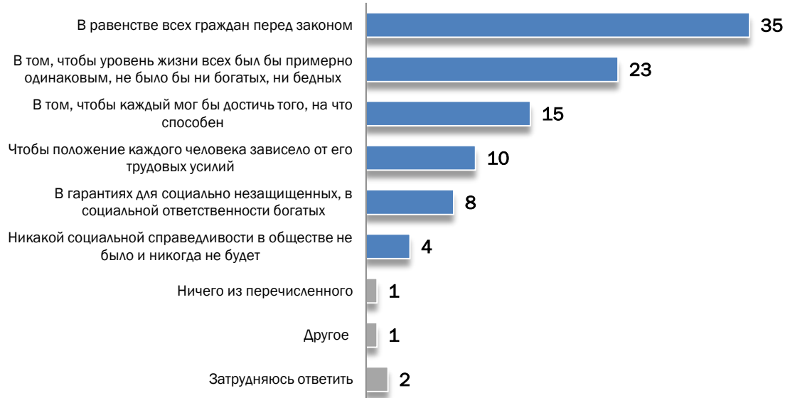
Диаграмма №4. У каждого человека есть свое понимание социальной справедливости. В чем, на Ваш взгляд, состоит социальная справедливость? (% от всех опрошенных)