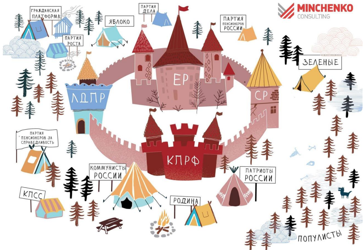
Иллюстрация №1. Экосистема российских политических партий

База правящей элиты, «детинец» ее крепости, партия «Единая Россия», демонстрирует достаточно высокую степень устойчивости даже в условиях снижения рейтингов власти. В частности, этому способствует система конкурентных праймериз, позволяющая тестировать электоральную эффективность потенциальных кандидатов на выборы разного уровня и обновлять состав элит за счет «свежей крови». Однако можно предположить, что посткрымские экстремумы рейтинговых показателей для ЕР остались в прошлом.